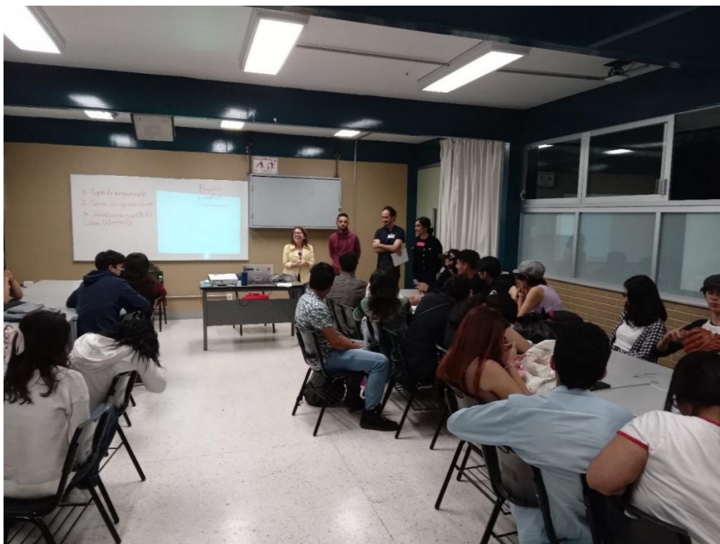
Figura 4. Sesión final y premiación de los materiales audiovisuales elaborados.

Luego de la implementación de la estrategia didáctica se realizó un diagnóstico final con el objetivo de visualizar los resultados obtenidos con la misma y realizar comparaciones con el punto de partida. Fue aplicado al total de estudiantes que participaron en la estrategia, por lo que no se realizó una división entre grupos para poder establecer tendencias y generalizaciones. Complementariamente se utilizó la observación del desempeño de los estudiantes durante la estrategia, la observación consistió en el registro sistemático, válido y confiable de comportamientos o conducta manifiesta de los estudiantes.