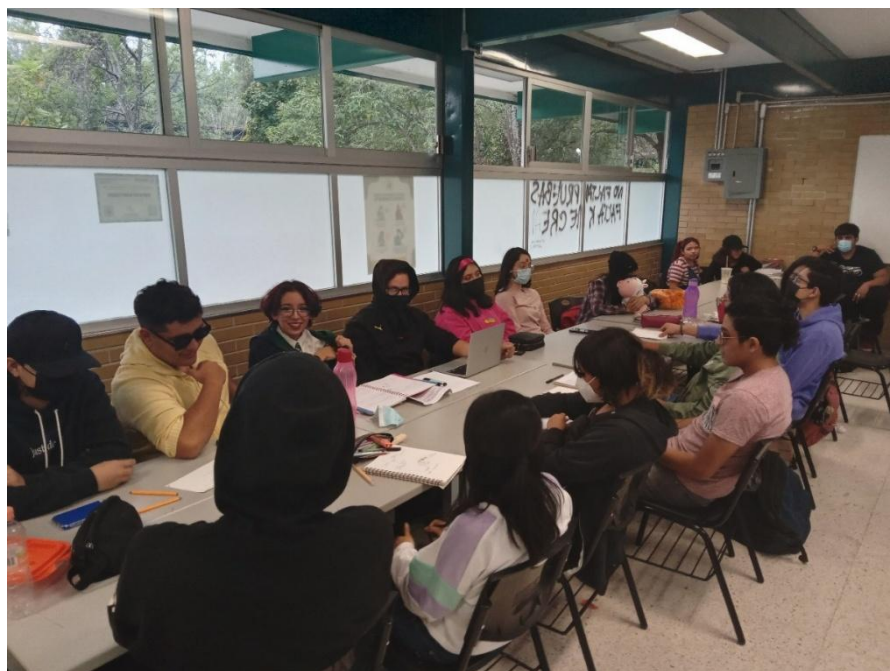
Figura 2. Organización y trabajo en equipos durante la implementación de la estrategia didáctica.

En todos los casos la duración de las sesiones fue de dos horas y se orientaron actividades de trabajo extraclase. La organización del trabajo docente fue por equipos de seis y siete integrantes. El tipo de evaluación varió en dependencia de las actividades, pero en la mayor parte de los casos se utilizó la rúbrica como instrumento. La Figura 2 muestra la organización y el trabajo en equipos.