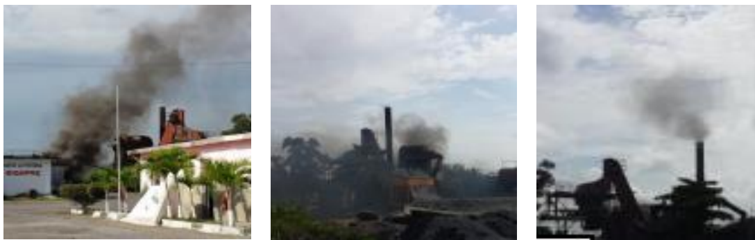
Figura 2. Emisiones de gases a la atmosfera durante el proceso productivo de la Planta de Asfalto.

El 90 % de los trabajadores encuestados expresó que la planta afecta el medio ambiente. La Figura 2 muestra las evidencias de la emisión de gases y su afectación al medio ambiente por la Planta de Asfalto durante su funcionamiento.